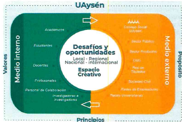
Imagen 2. Modelo de vinculación con el medio/espacio Creativo