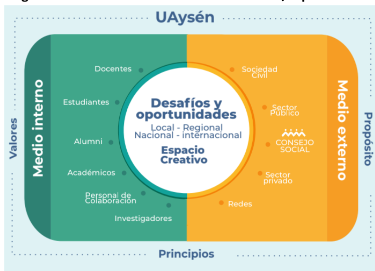
Imagen 2. Modelo de vinculación con el medio/espacio Creativo